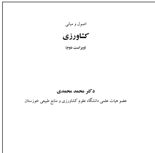
شکل ۱- نمونه صفحه ی عنوان مورد استفاده

این بخش شامل نام کتاب، نویسنده (گان)، آدرس نویسندگان به شرح زیر و تاریخ انتشار است که در آغاز کتاب، آورده می شود (شکل ۱).